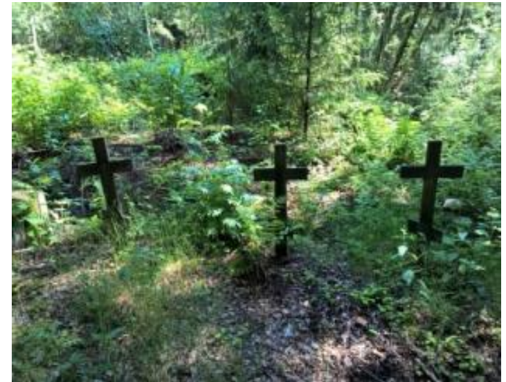
No. 8, 9, 10