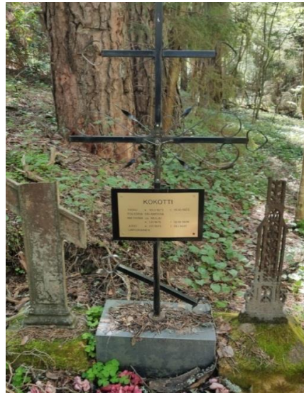
No. 4, 5, 6